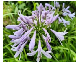
牧野北分館 今月の植物 アガパンサス