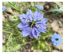
牧野北分館 今月の植物 ニゲラ