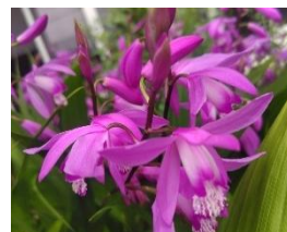
牧野北分館 今月の植物 シラン