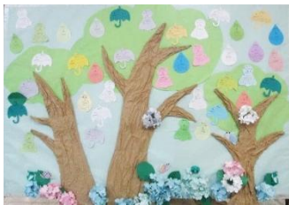
2024年開催時の様子。テーマは「梅雨のパノラマ」でした

2月14日はバレンタインデー。気持ちを伝える2月におすすめしたい本はありますか？ みんなに紹介したい本を用紙に書いて“本の木”を彩りましょう。今回のテーマは「愛と友情」です。