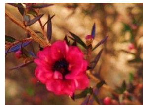
牧野北分館 今月の植物 ギョリュウバイ