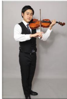
ヴァイオリニスト 福岡昂大さん(兄)

※対象は小学生以上 参加費■前売り1000円、当日200円。小学生はいずれも500円 申込■1月5日(日)午前10時から先着順。上記記載の電話、FAXから 定員■先着120人 全国で活躍中の福岡兄弟によるバイオリンとピアノのコンサート。演奏の合間のトークもお楽しみに。