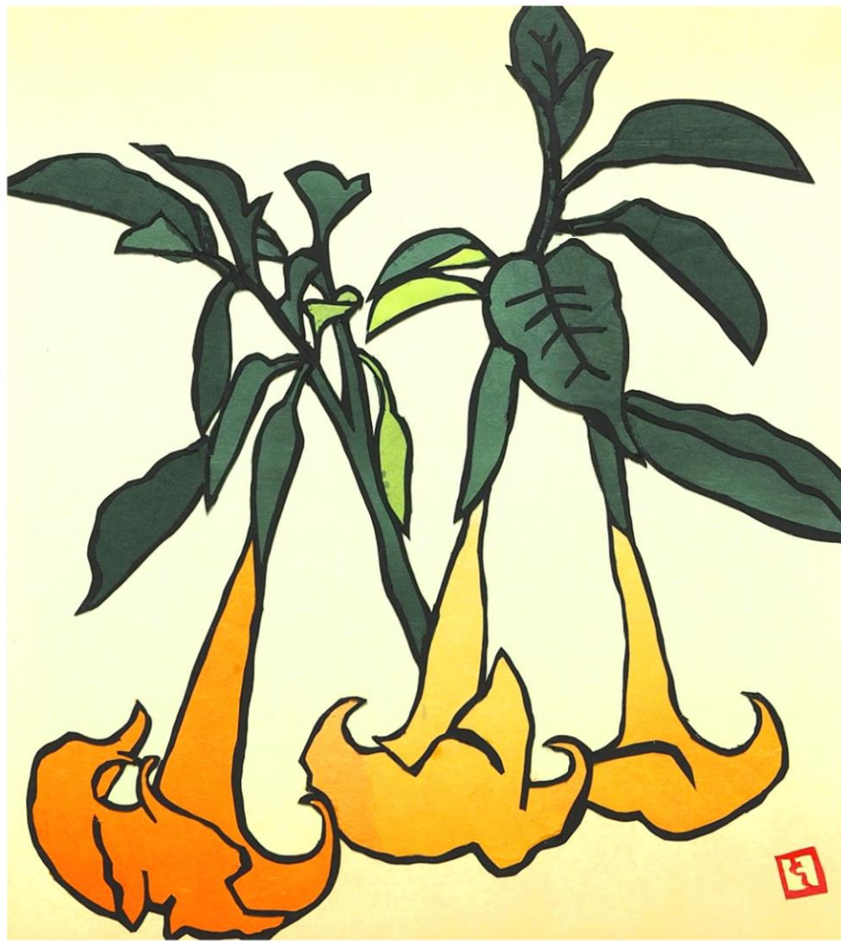
今月の1枚：エンジェルズ・トランペット 徳留 久美子（とくどめ くみこ）（枚方きりえ倶楽部）〈不許複製〉