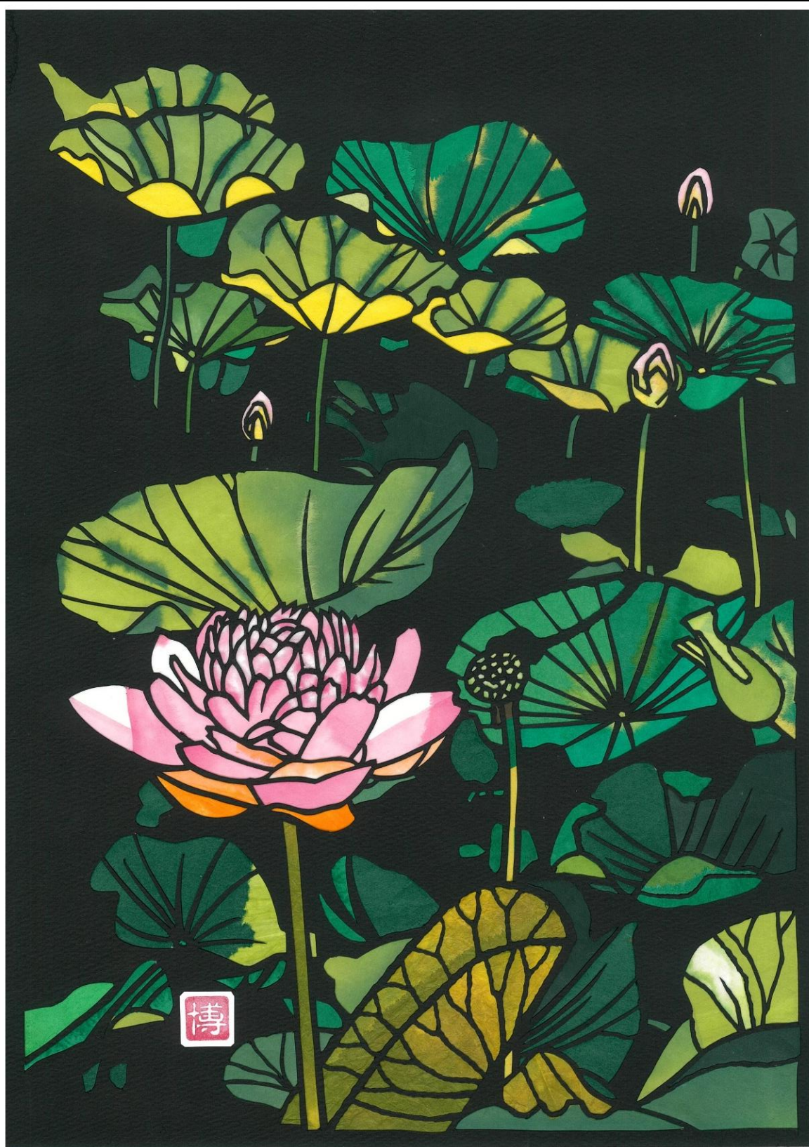
今月の1枚：蓮 辻 博樹（枚方きりえ倶楽部） <不許複製>