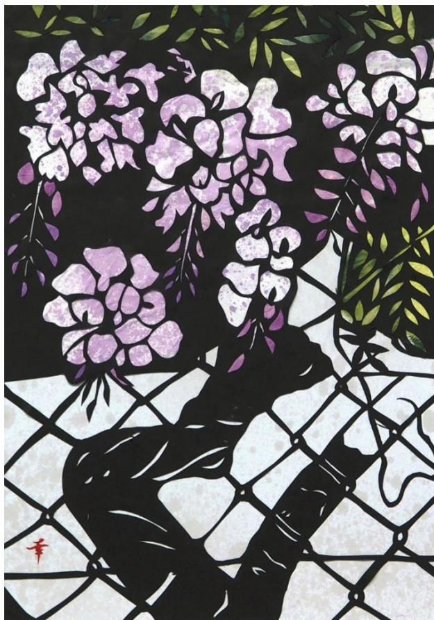
今月の1枚：ふじ 阿部幸枝（枚方きりえ倶楽部） <不許複製>