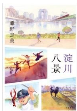
淀川八景 藤野恵美/著 文藝春秋 2019年4月出版

すれ違い始めた妻の気持ちを思いながら、夫は淀川源流を目指し歩く。『ひとりで、どこまでも、歩いてみよう。川の流れに逆らって……。』(「ポロロッカ」より)大阪生まれ・大阪育ち・大阪在住の著者が、淀川の風景を明るく、切なく、温かく描き出す短編集。