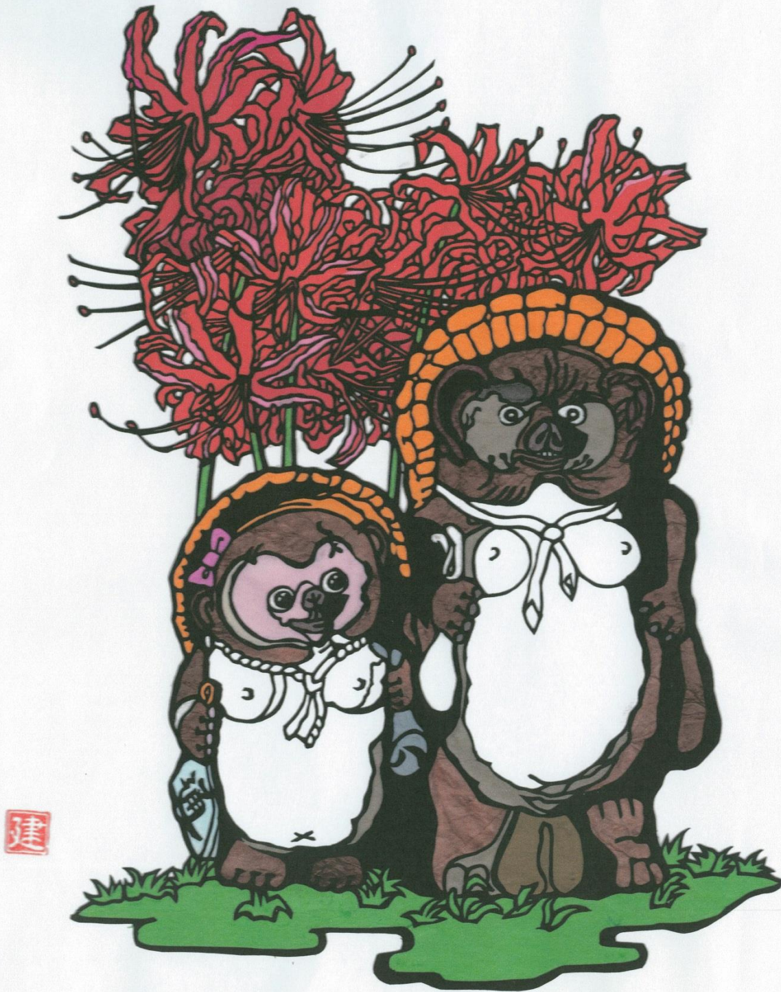
今月の1枚:「いつまでも」松本 建治 (枚方きりえ倶楽部)