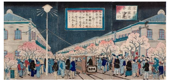
「東京銀座通電気燈建設之図」